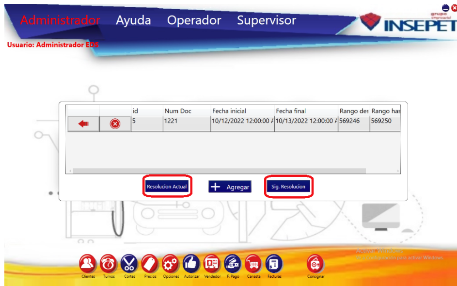
Imagen 1. Interfaz Facturas

Dicha función se encuentra en la Ruta Administrador > Facturas , en esta se desplegará la siguiente interfaz: