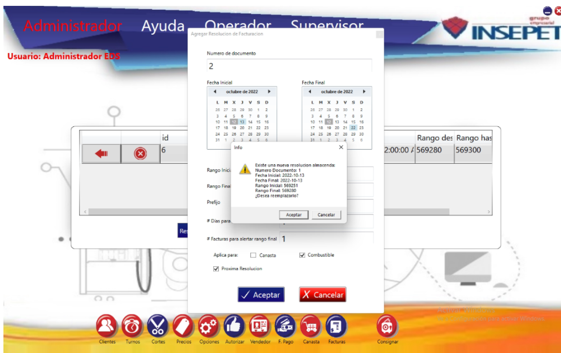
Imagen 3. Alerta nueva resolución creada

Por otra parte el sistema solo permite crear una única 'siguiente resolución', si el usuario intenta crear nuevamente otra resolución, el sistema le avisará que ya existe una resolución y le confirma si desea efectuar dichos cambios, así como lo muestra la Imagen 3.